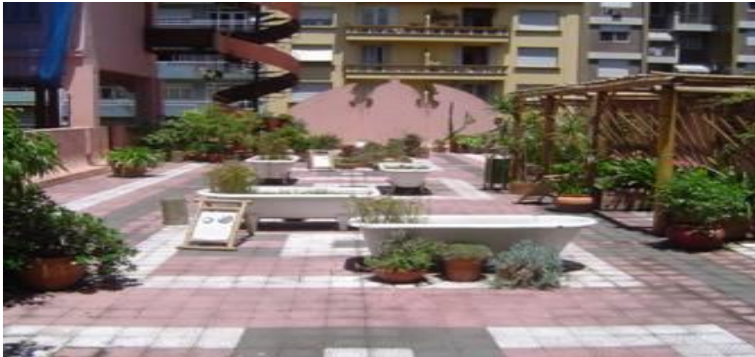
Jardim do quinto andar da Casa de Cultura Mário Quintana, Recanto da Poesia